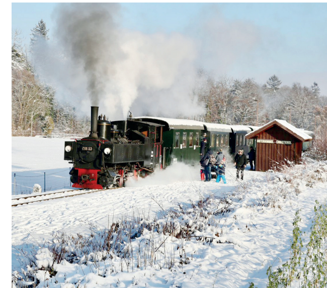
Halt in Unterrhimmel-Christkindl

*) am 14. Dez. fährt der letzte Zug von Grünburg erst um 18.15 h ab, damit ihn auch Besucher des Perchtenlaufes erreichen können.